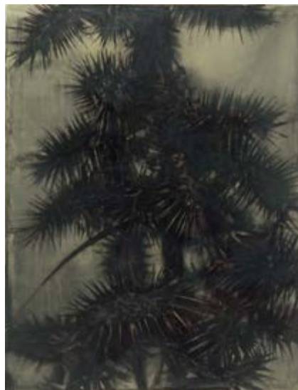
Foto links: Tom Waits door Anton Corbijn. Foto rechts: artwork van Jan De Maes- schalck.